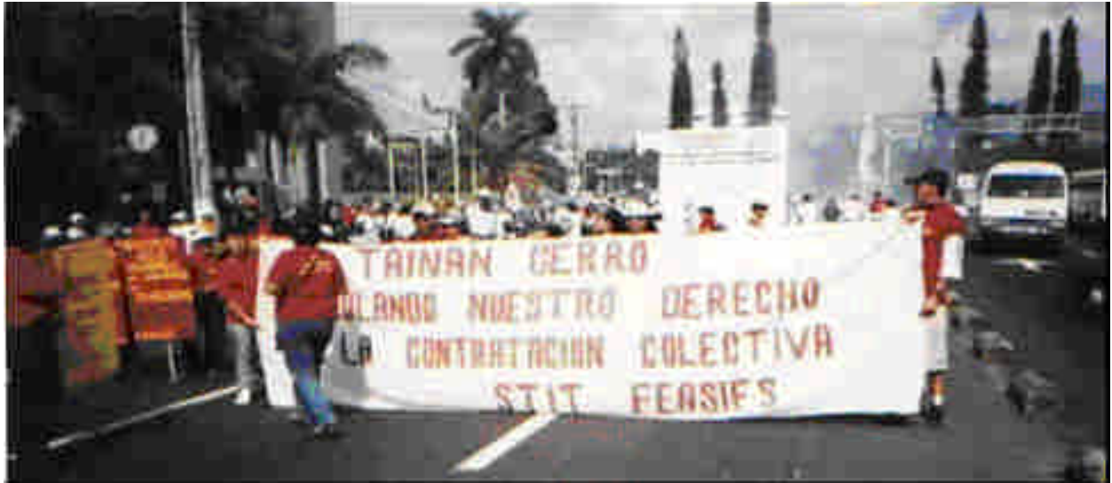
圖 2. STIT 工會發起的抗議台南企業示威遊行