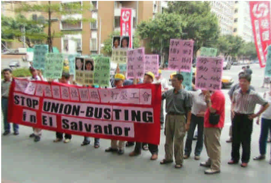
圖 3. 國際串聯聲援行動日，台灣團體在台南企業台北辦事處前抗議