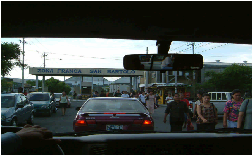
圖 1. 聖巴托羅自由貿易區大門

台南企業（以下簡稱台南）是台資的成衣代工公司，主要客戶包括 Gap、Ann Taylor、Target 及 Kohl's 等美國的大品牌及大零售商。台南除了在台灣本地之外，還在中國、柬埔寨、印尼等地有設廠 6 ，而薩爾瓦多的投資是開始於 2000 年。薩爾瓦多廠位於聖巴托羅（San Bartolo）自由貿易區，那是在薩國首都聖薩爾瓦多市東郊的依羅龐哥（Ilopango）地區，又分為一廠及二廠，在發生爭議的時候，總共約有 1,500 名工人。